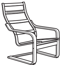
Atpūtas krēsla rāmis: bērzkoka, ozolkoka balts, ozol-koka brūns, dižskabārža, melni brūns.

1. Izvēlies rāmi. Rāmji izgatavoti no dažādiem materiāliem, un tiem ir atšķirīgi apdares veidi.