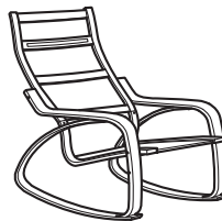
Šūpuļkrēsla rāmis: bērzkoka, ozolkoka balts, ozol-koka brūns, dižskabārža, melni brūns.