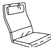
Pārvalki: VISLANDA (auduma).