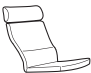
Pārvalki: HILLARED, LYSED (auduma) vai GLOSE un SMIDIG (ādas).

Krēsla polsterējuma pārvalki ir visādās krāsās, atšķirīgos rakstos un izgatavoti no dažādiem materiāliem. Kombinē tos, kā vēlies.